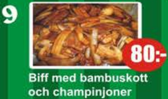
9 Biff med bambuskott och champinjoner 80:-