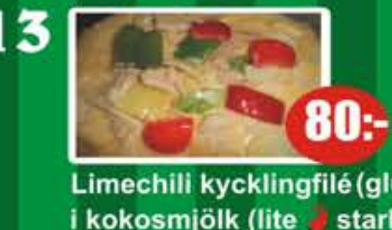
13 Limechili kycklingfilé (glutenfri) i kokosmjölk (lite stark) 80:-