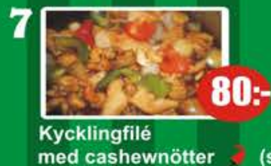
7 Kycklingfilé med cashewnötter (stark) 80:-