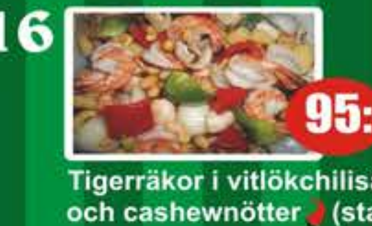
16 Tigerräkor i vitlökhillisås och cashewnötter (stark) 95:-