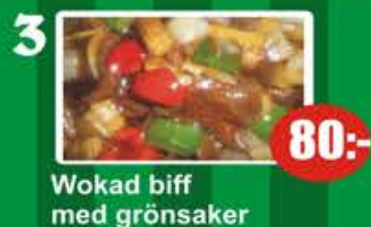
3 Wokad biff med grönsaker 80:-