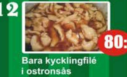
12 Bara kycklingfilé i ostronsås 80:-