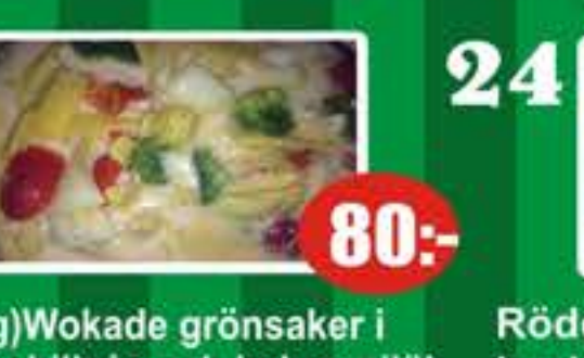
23 (Veg)Wokade grönsaker i limechillisås och kokosmjölk (glutenfri) (lite stark) 80:-