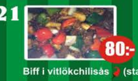
21 Biff i vitlökhillisås (stark) 80:-