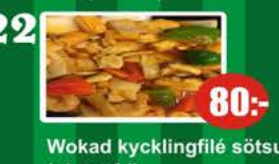
22 Wokad kycklingfilé sötsursås (glutenfri) 80:-