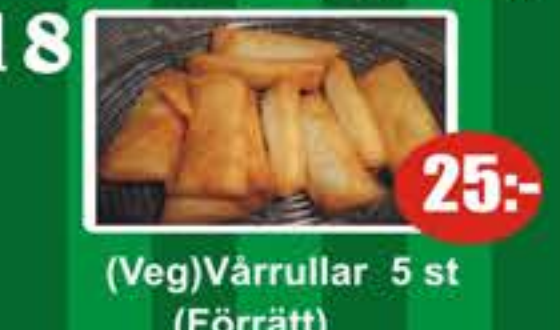
18 (Veg)Vårullar 5 st (Förrätt) 25:-