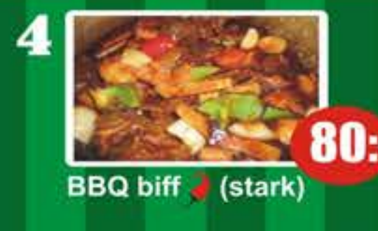
4 BBQ biff (stark) 80:-