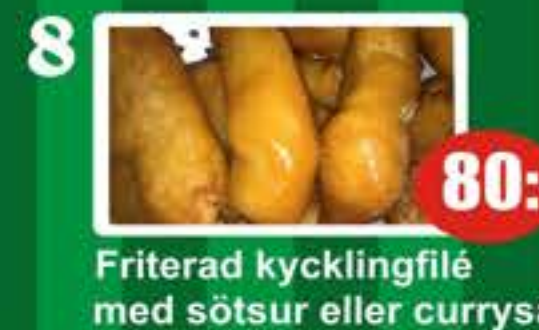
8 Friterad kycklingfilé med sötsur eller currysås 80:-