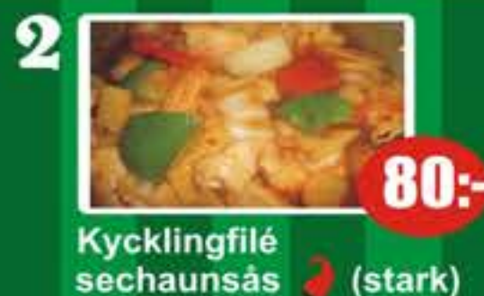
2 Kycklingfilé sechaunsås (stark) 80:-