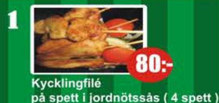
1 Kycklingfilé på spett i jordnötssås (4 spett) 80:-