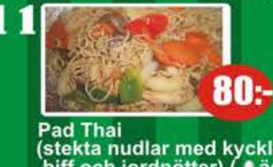
11 Pad Thai (stekta nudlar med kycklingfilé, biff och jordnötter) (ägg) 80:-