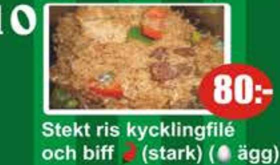
10 Stekt ris kycklingfilé och biff (stark) (ägg) 80:-