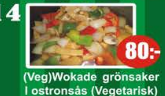
14 (Veg)Wokade grönsaker i ostronsås (Vegetarisk) 80:-