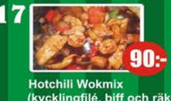
17 Hotchili Wokmix (kycklingfilé, biff och räkor) (stark) 90:-