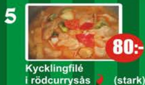
5 Kycklingfilé i rödcurrysås (stark) 80:-