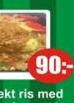
25 Kryddigt stekt ris med kycklingfilé på spett i jordnötssås. 2spett (stark) 90:-

Allergener i våra maträtter: Nötter, vetemjöl, fisk, ägg, sojaböner, jordnötter, blötdjur & kräddjur. Önskemål vid allergi fråga personalen!