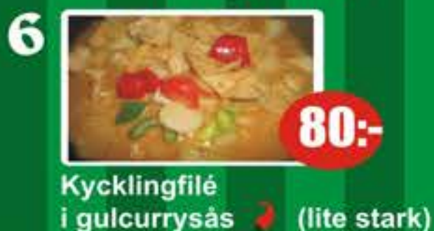
6 Kycklingfilé i gulcurrysås (lite stark) 80:-