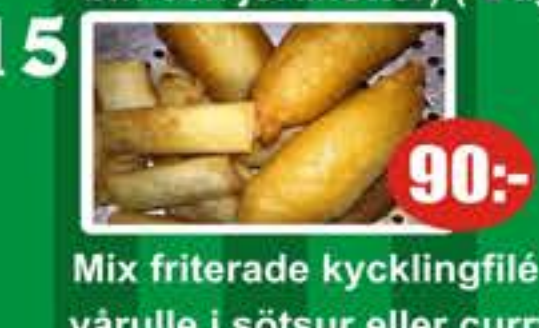
15 Mix friterade kycklingfilé och värulle i sötsur eller currysås 90:-