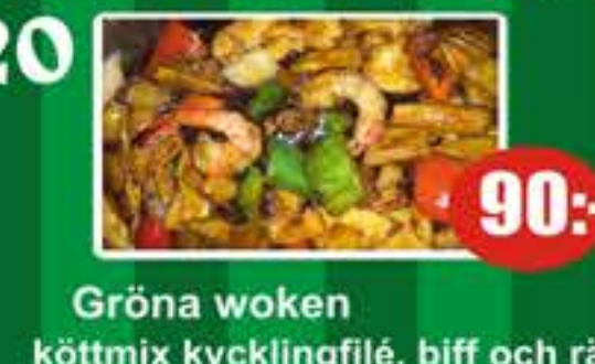
20 Gröna woken köttmix kycklingfilé, biff och räkor 90:-